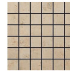
STRATUS 36 YURA BEGE (a) (f)