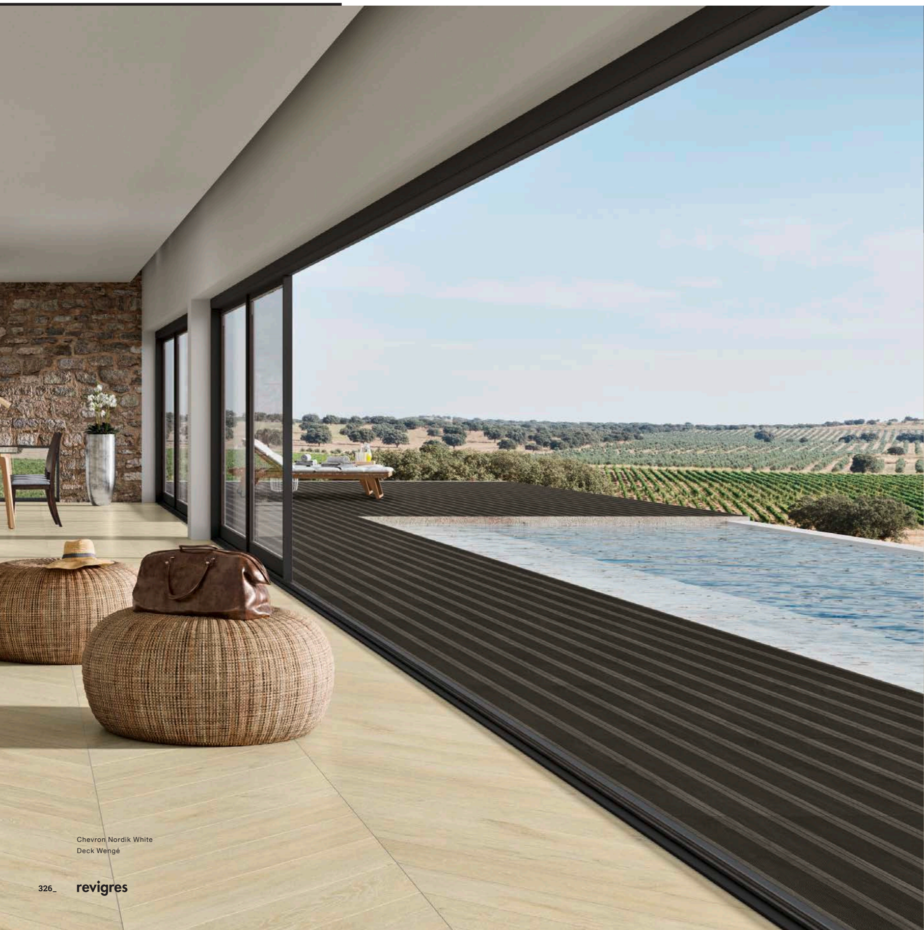
Chevron Nordik White Deck Wengé