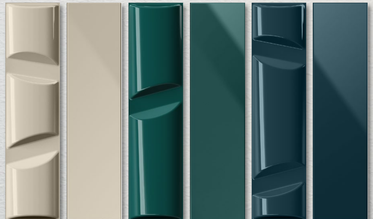
VOLUME 5 CROMIA 5 VOLUME 12 CROMIA 12 VOLUME 14 CROMIA 14

BAGNO / BATHROOM , rivestimento / covering VOLUME 2 (cm. 10x40 - 4"x16"), Cromia 2 (cm. 10x40 - 4"x16"). Pavimento/Flooring Cromia 2 (cm. 10x40 - 4"x16").