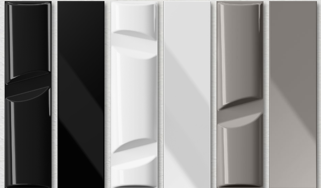
VOLUME 1 CROMIA 1 VOLUME 2 CROMIA 2 VOLUME 4 CROMIA 4