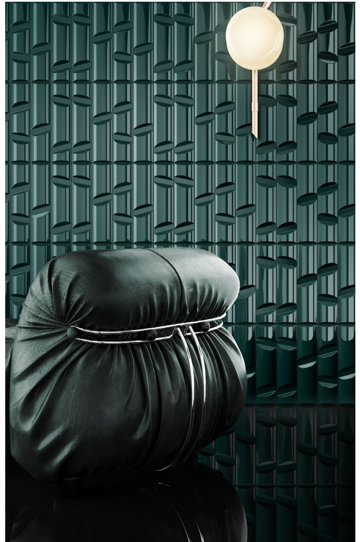
OFFICE , rivestimento / covering VOLUME 4 (cm. 10x40 - 4"x16"), Cromia 4 (cm. 10x40 - 4"x16"). LIVING , rivestimento / covering VOLUME 12 (cm. 10x40 - 4"x16").